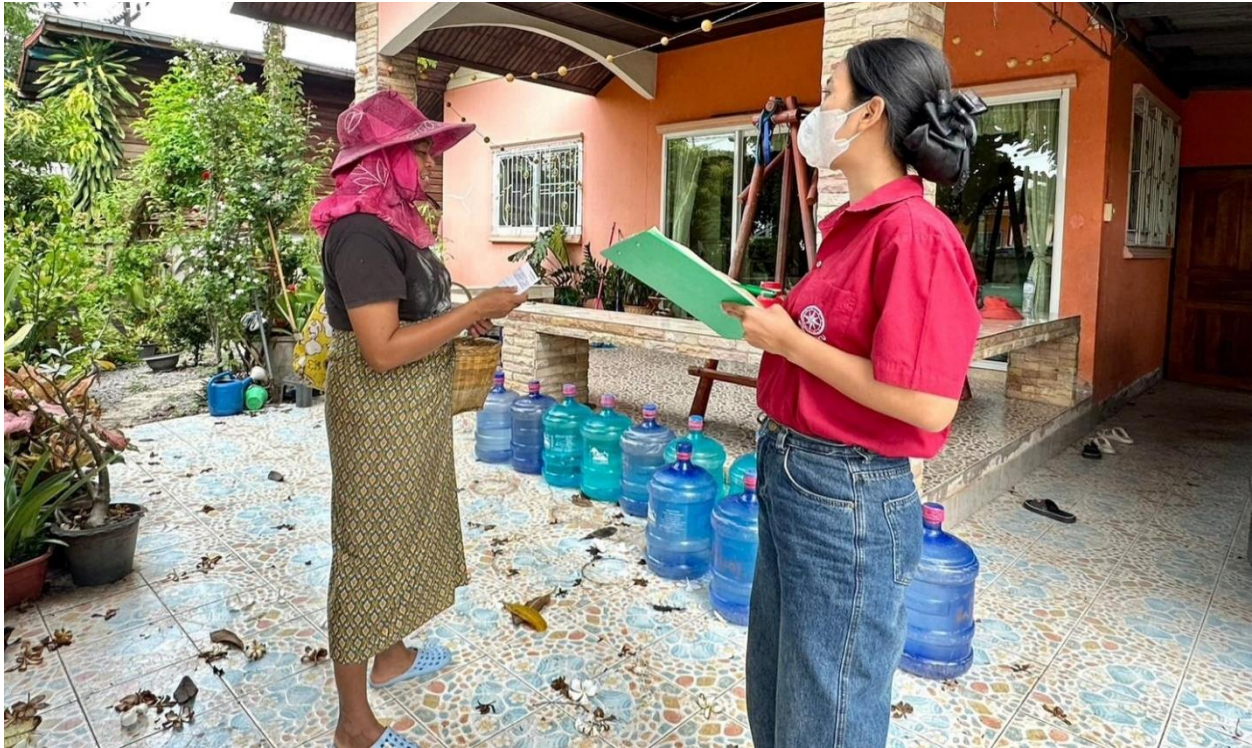
ภาพที่ 5.7 ทีมงานนักวิจัยลงพื้นที่แจกแบบสอบถามในเขตองค์การบริหารส่วนตำบลบ้านเชียง อ.หนองหาน (6)