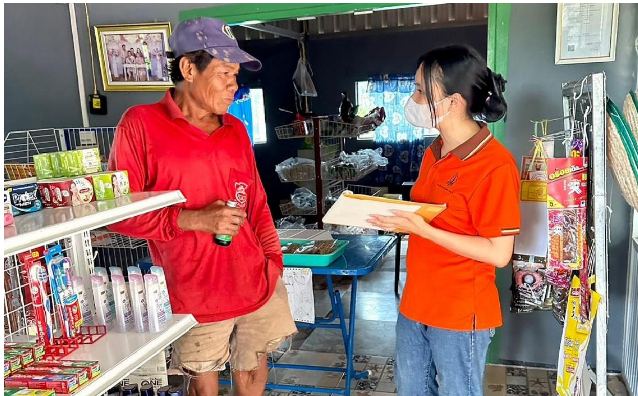
ภาพที่ 5.2 ทีมงานนักวิจัยลงพื้นที่แจกแบบสอบถามในเขตองค์การบริหารส่วนตำบลบ้านเชียง อ.หนองหาน (2)